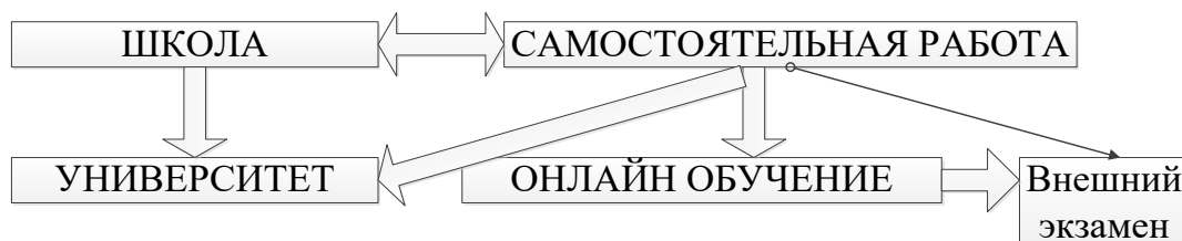
Рисунок 1 — Две альтернативы получения высшего образования

В современной модели обучения приоритет отдается самостоятельной мотивированной работе. Сравнительная характеристика самостоятельной работы в двух моделях высшего образования представлена на рисунке 2.