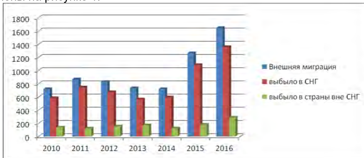
Рисунок 1 - Внешняя миграция из Могилевской области за 2010-2016 гг.

ней миграции из Могилевской области за последние семь лет, представлены на рисунке 1.