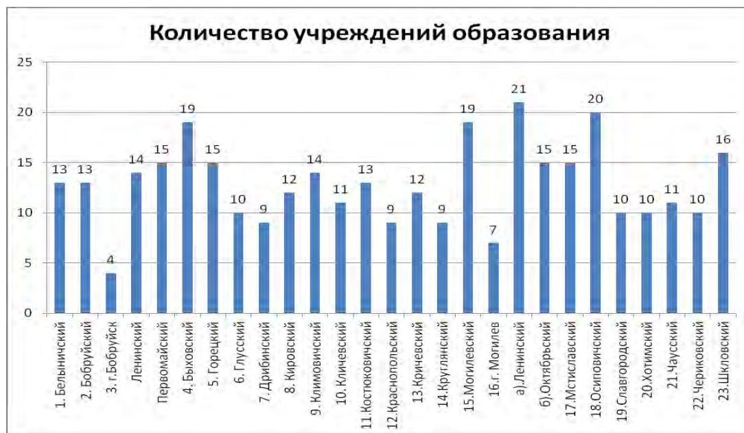
Рисунок 1 – Количество учреждений образования Могилевской области

. Отслеживать необходимо, в первую очередь, не количество учреждений образования, а количество выпускников по каждому району. Поэтому следующим этапом исследования рынка потенциальных абитуриентов, необходимо уточнить количество выпускников средних учреждений образования. На рисунке 2 представлено общее количество выпускников по районам Могилевской области.