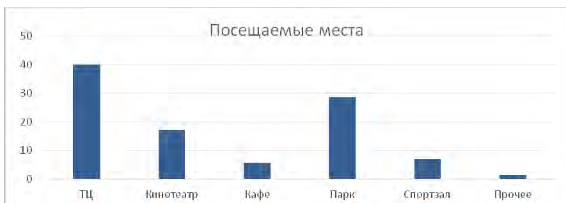
Рисунок 2 – Наиболее часто посещаемые места

На рисунке 2 представлена диаграмма, иллюстрирующая наиболее часто посещаемые места, где молодые люди предпочитают проводить свое свободное время.