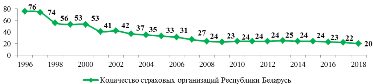
Рис. 1. Динамика количества страховых организаций Республики Беларусь [1]

на рисунке 1 (данные по 2018 г. выбраны на 01.09.2018 г.).