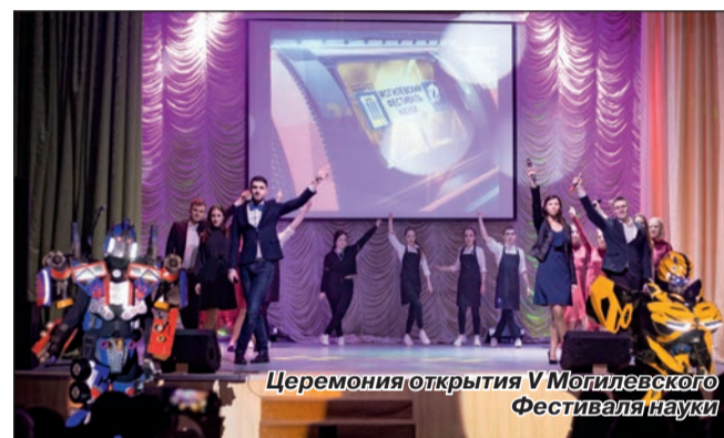
Церемония открытия VI Могилевского Фестиваля науки