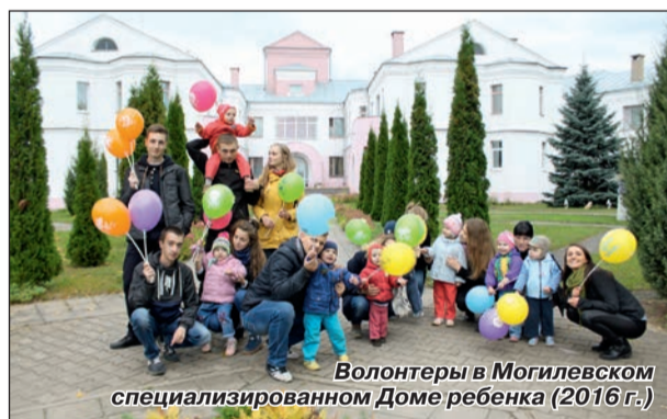
Волонтеры в Могилевском специализированном Доме ребенка (2016 г.)