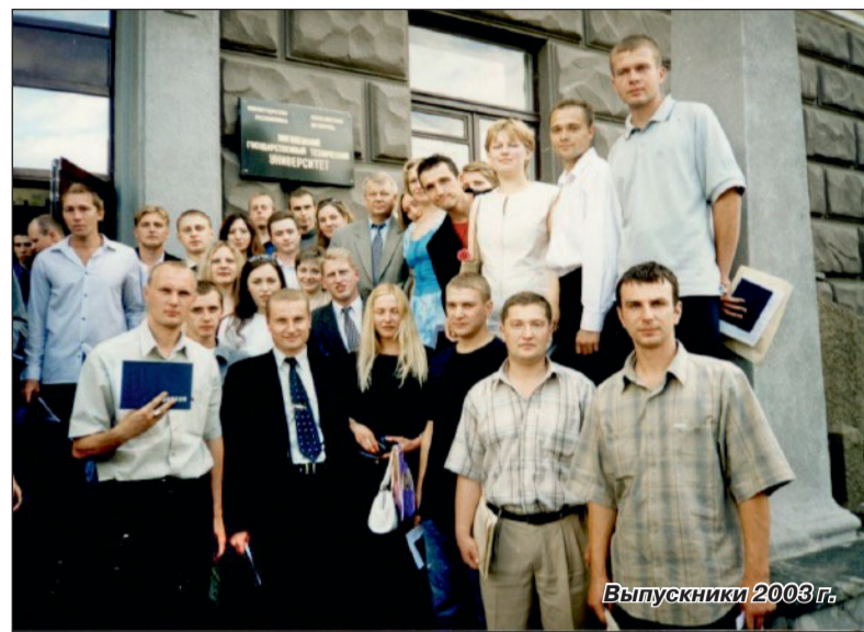
Выпускники 2003 г.