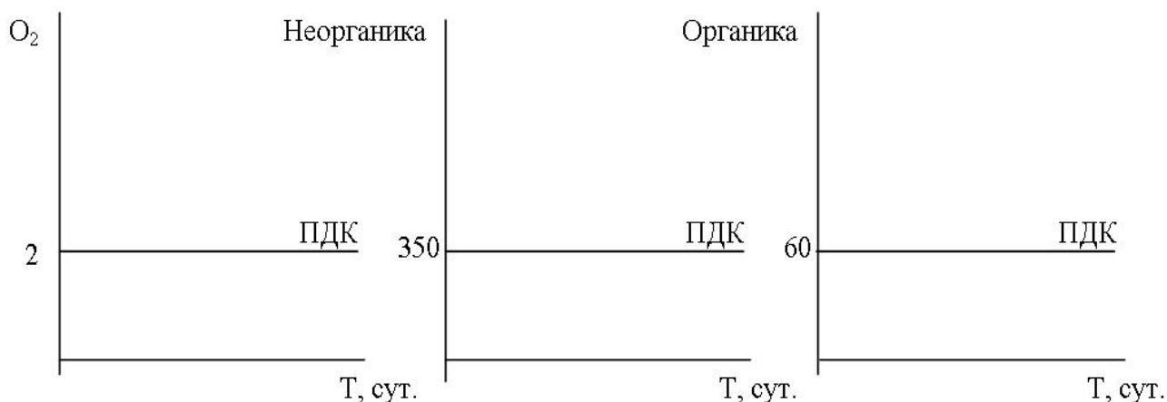
Рисунок 9.1 – Динамика изменения параметров системы в промышленной зоне

4 Сделать выводы по результатам работы за два месяца.