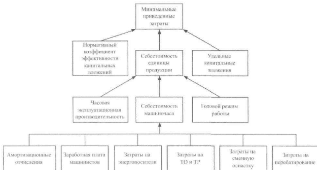
Рис. 1. Структурная схема существующей методики оценки эффективности использования машин

Использование показателя минимальных приведенных затрат при оценке эффективности использования машин практически в первоизданном виде широко встречается в современной литературе. Однако в настоящее время в условиях рыночной экономики предъявляются повышенные требования к точности получаемых результатов с учетом применения машин, реализующих современные технологии.