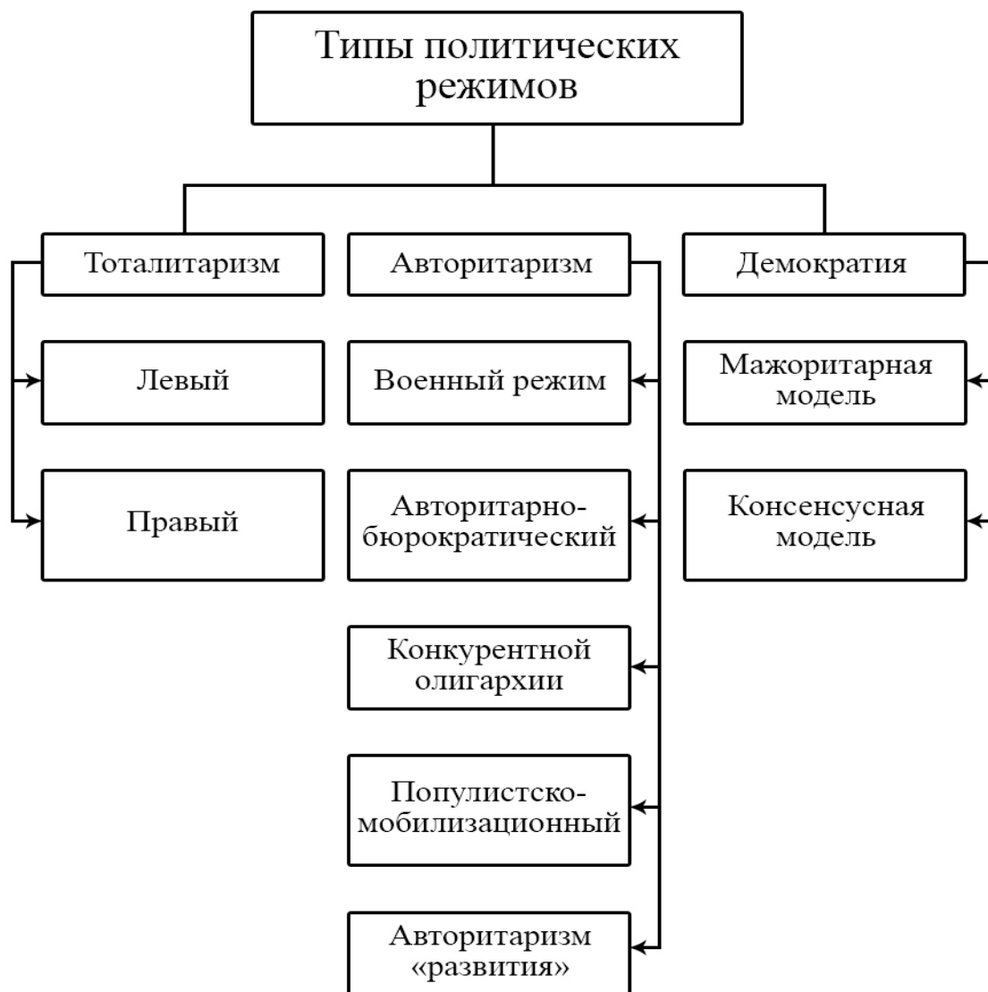
Рисунок 1 – Типология политических систем по типам политических режимов

Политические системы подразделяются по типам политических режимов (рисунок 1).