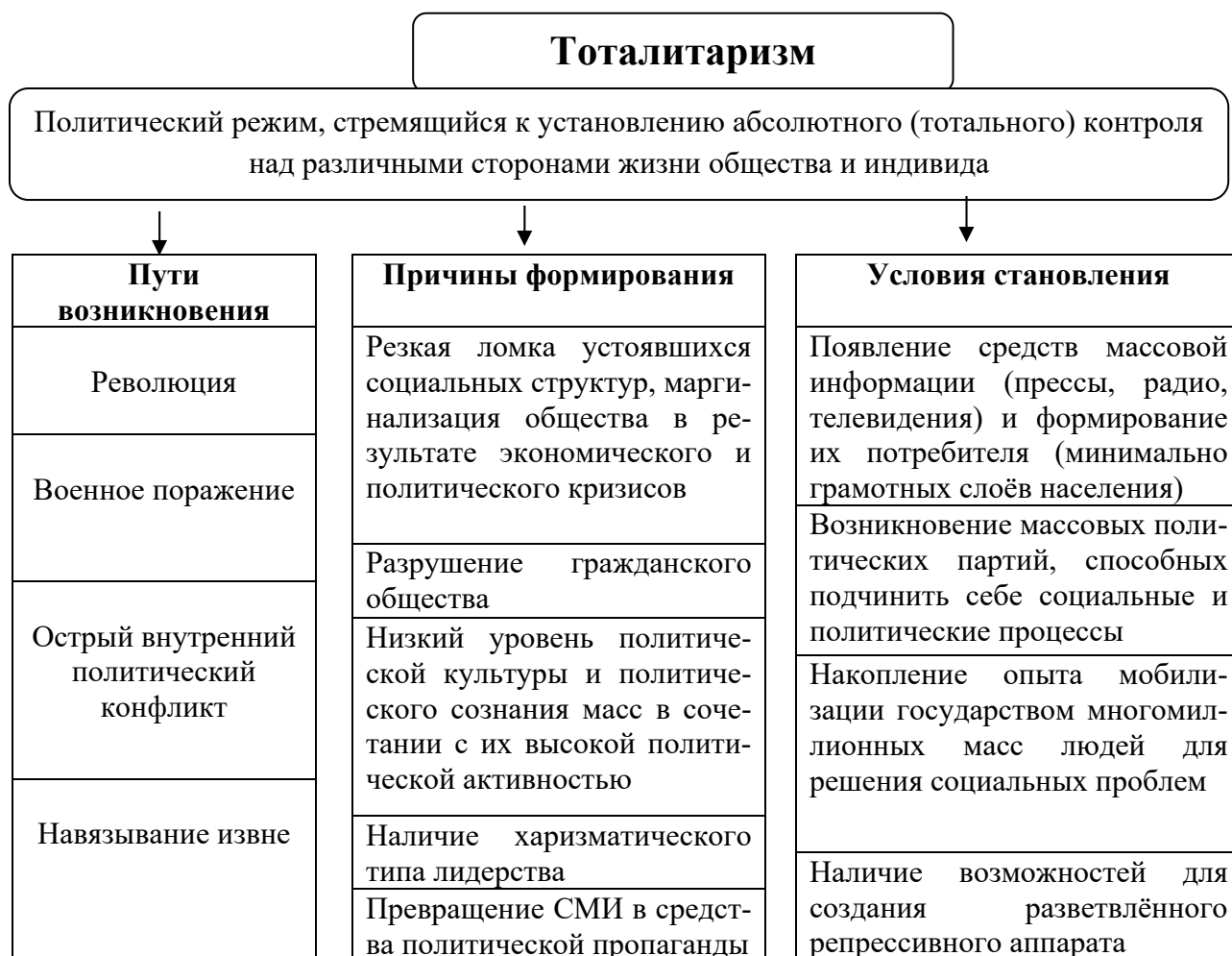
Рисунок 4 – Понятие и сущность тоталитаризма

Тоталитаризм отличается от других диктатур наиболее высокой степенью регламентации и контроля и является «реакцией» общества на кризисы периода индустриализации, ускоренную модернизацию, форсирование, догоняющее