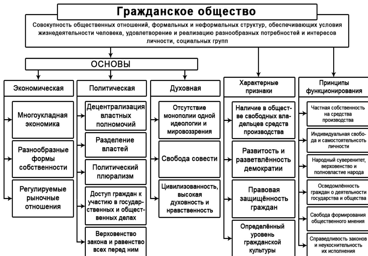
Рисунок 2 – Гражданское общество

экономической основе разнообразных форм собственности, многоукладной рыночной экономики. Обязательное регулирование взаимоотношений всех элементов гражданского общества на основе гражданского права позволяет преодолеть возможные конфликты, выработать политику в интересах всего общества.