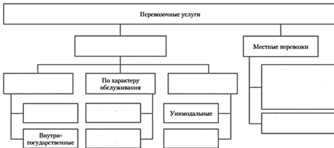
Рисунок 2.1 – Классификация перевозочных услуг

Изучите классификацию перевозочных услуг. Заполните недостающие поля на рисунке 2.1.