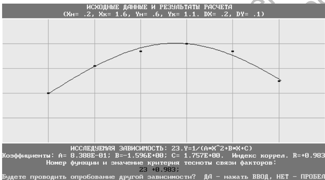
Рис. 2. Зависимость коэффициента высоты уступа от относительной высоты уступа

Определим верхнее значение \bar{h} , обеспечивающее попадание случайного значения \bar{h} в интервал [0, \bar{h}] с вероятностью P(\bar{h}) :