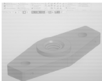
Рис. 1. Создание 3D-модели

3) начать печать модели на 3D-принтере ULTIMAKER (рис. 3).