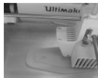
Рис. 3. Печать детали