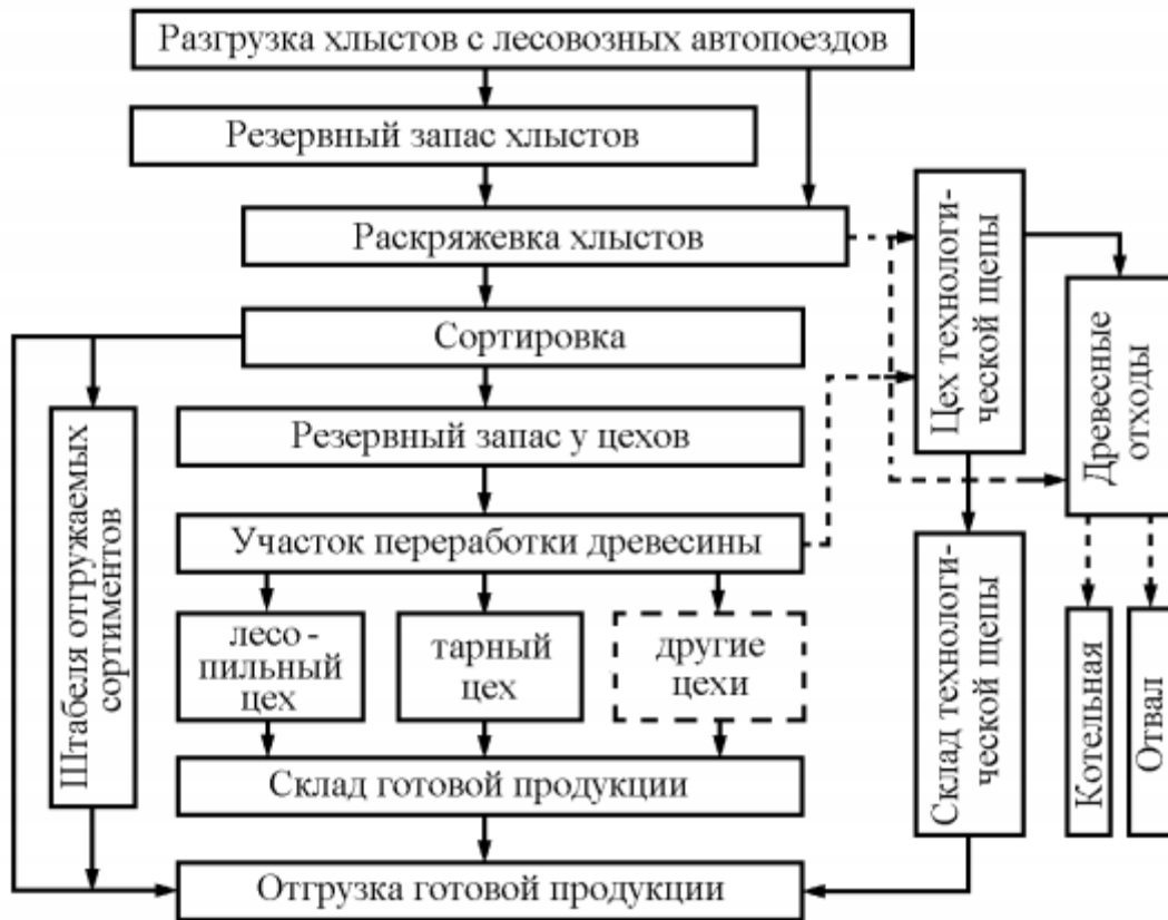
Рисунок 8.1 – Структурная схема технологического процесса прирельсового нижнего склада при вывозке на склад хлыстов

(продольно-поперечной) подачей древесного сырья в обработку; 2НС – с поперечной (поперечно-продольной) подачей древесного сырья в обработку.