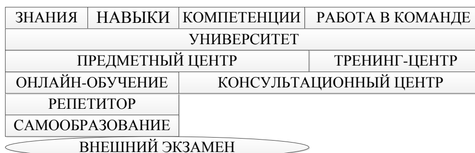
Рисунок 2 — Формы реализации требований образовательных стандартов

Для гуманитарных предметов и специальностей приобретение навыков возможно в рамках самообразования и не предполагает обязательное посещение аудиторных занятий. Альтернативой может быть онлайн-общение с преподавателем-консультантом, посещение краткосрочных курсов интенсивного обучения. А вот для приобретения навыков работы в команде посещение того или иного учебного заведения обязательно. Это могут быть подразделения университетов или самостоятельные учебные центры, которые будут выдавать соответствующие сертификаты.