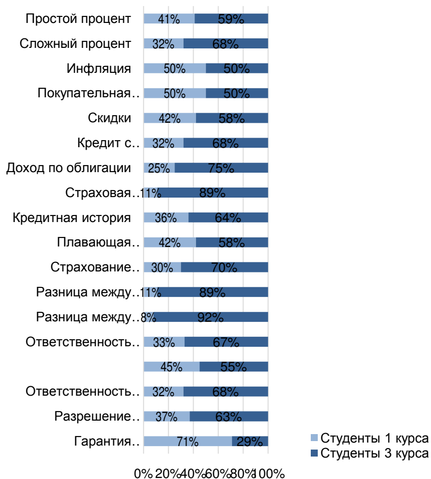
Рис. 2. Структура правильных ответов студентов 1-го и 3-го курсов

Практически на все вопросы большинство правильных ответов дали студенты 3-го курса, кроме вопросов об инфляции и скидках (равное количество ответивших верно студентов), а также вопроса о гарантии банковских вкладов (71 % правильных ответов из общего количества дали студенты 1-го курса). Большая часть студентов 3-го курса правильно ответили на вопрос о простом и сложном проценте, соответственно, 59 % и 68 %. Из тех, кто правильно рассчитал доход по облигации, студенты 1-го курса составляют лишь 25 %, а из тех, кто знает разницу между акцией и облигацией – лишь 8 %. Доля правильных ответов студентов 1-го курса на вопрос о разнице между страхованием жизни и страхованием рисков составляет 30 %, а на вопрос о страховой франшизе – только 11%. Исходя из вышеприведенных данных, следует вывод о приобретенных знаниях в процессе получения высшего профессионального образования студентами 3-го курса.