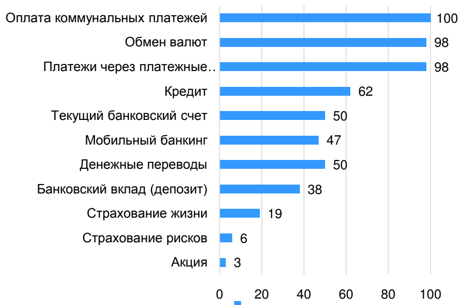
Рис. 1. Ответ на вопрос «Какими финансовыми услугами пользуетесь Вы или члены Вашей семьи?»

также банковский вкладной (депозитный) счет (38). Наименее интересными для студентов являются такие услуги как банковская платежная карта (6 из 106 опрошенных), обмен валют (6), потребительский кредит (11).