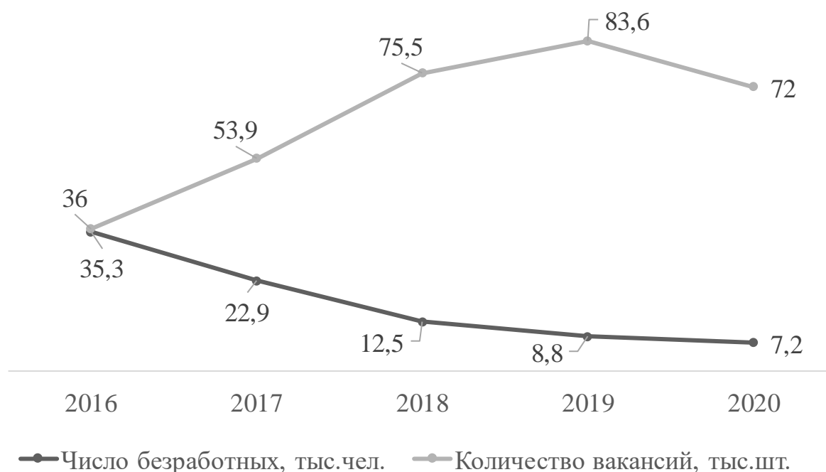
Рисунок 1 – Спрос и предложение на рынке труда в 2016-2020 гг., тыс. чел. Примечание – Источник: собственная разработка на основе [3]

Согласно закона предложения: чем меньшую заработную плату предлагает работодатель, тем меньшее количество работников претендуют на получение данной работы. Место пересечения этих двух экономических показателей позволяет определить реальный рынок труда. Спрос и предложение на рынке труда Республики Беларусь в 2016-2020 гг. представлен на рисунке 1.