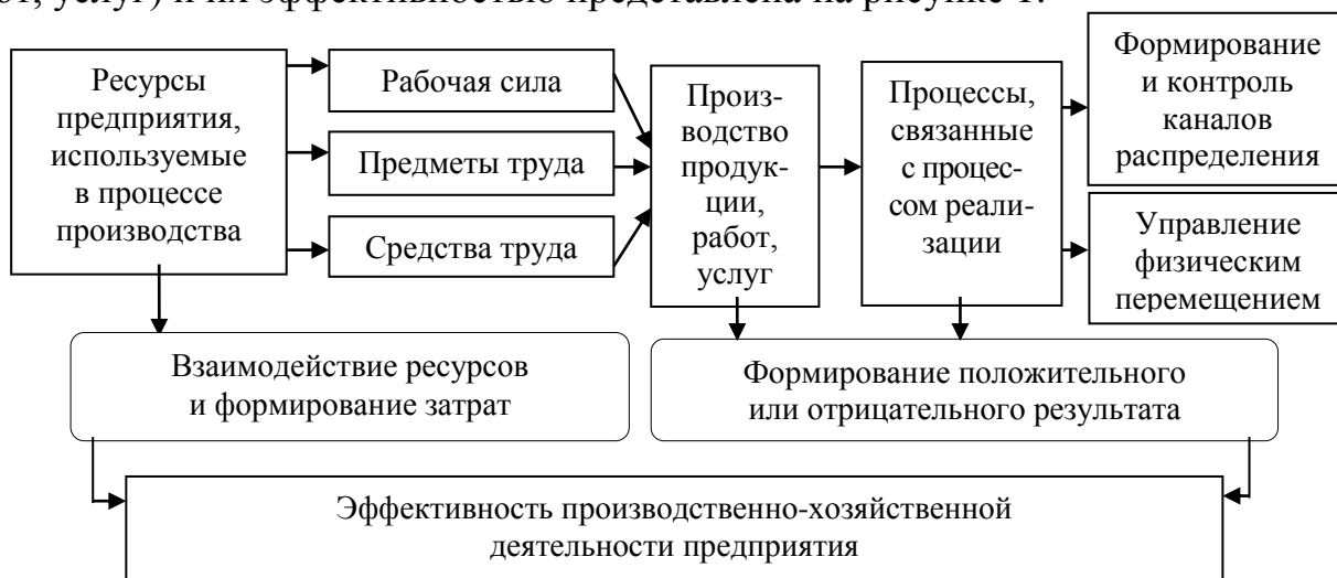
Рисунок 1 – Взаимосвязь между процессами производства и реализации продукции (работ, услуг) и их эффективностью

Взаимосвязь между процессами производства и реализации продукции (работ, услуг) и их эффективностью представлена на рисунке 1.