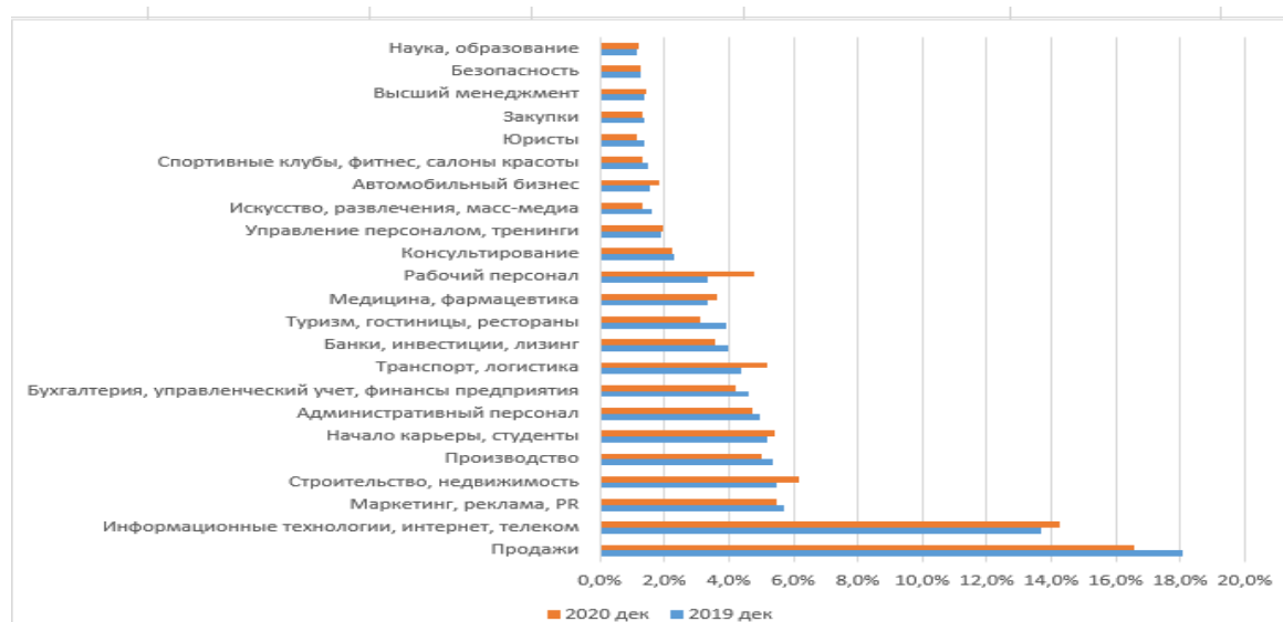
Рисунок 3- Структура рынка вакансий г. Москва декабрь 2019-2020г.г.

Примечание – разработка авторов на основе [1]