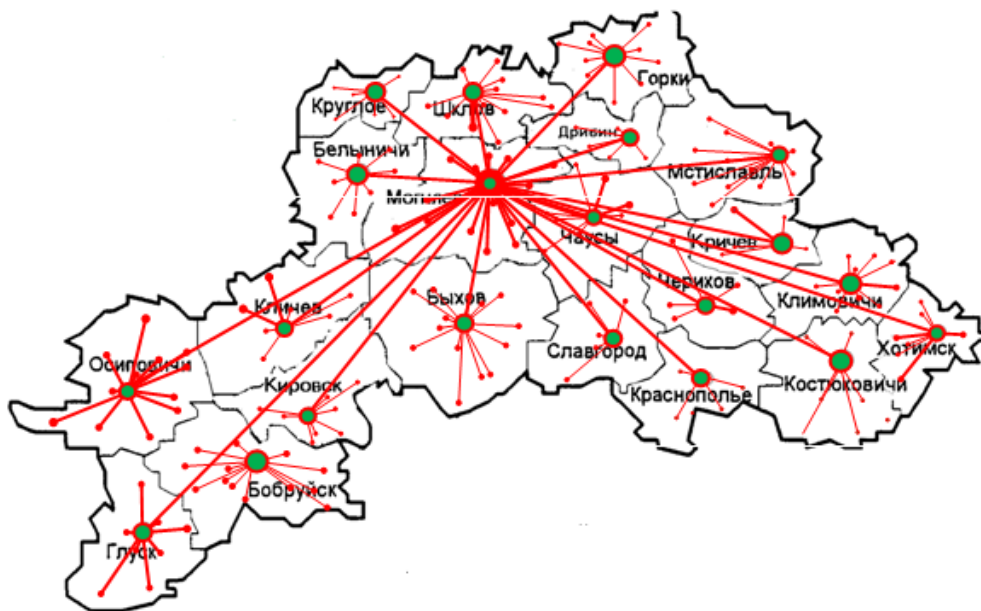
Рис.1 Структура КИС МО

Основной задачей концепции «электронный регион» является создание единого информационного пространства органов исполнительной и распорядительной власти, включающего в себя 4 уровня: республиканский, областной, районный и местный. В Могилевской области концепция «электронный регион» может быть реализована на базе корпоративной информационной сети Могилевского облисполкома (КИС МО), включающей в себя локальные вычислительные сети 12 подразделений облисполкома, 2 горисполкомов, 4 администраций районов Могилева и Бобруйска, 21 райисполкома, 175 сельсоветов [1]. Структура КИС МО приведена на рисунке 1. Структура единого информационного пространства приведена на рисунке 2.