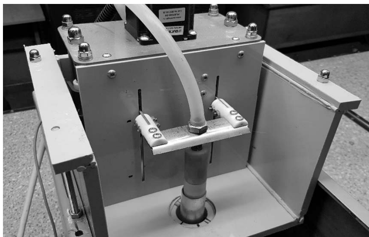
Рис. 1. Внешний вид оборудования для получения МДО покрытий на внутренних поверхностях трубчатых изделий