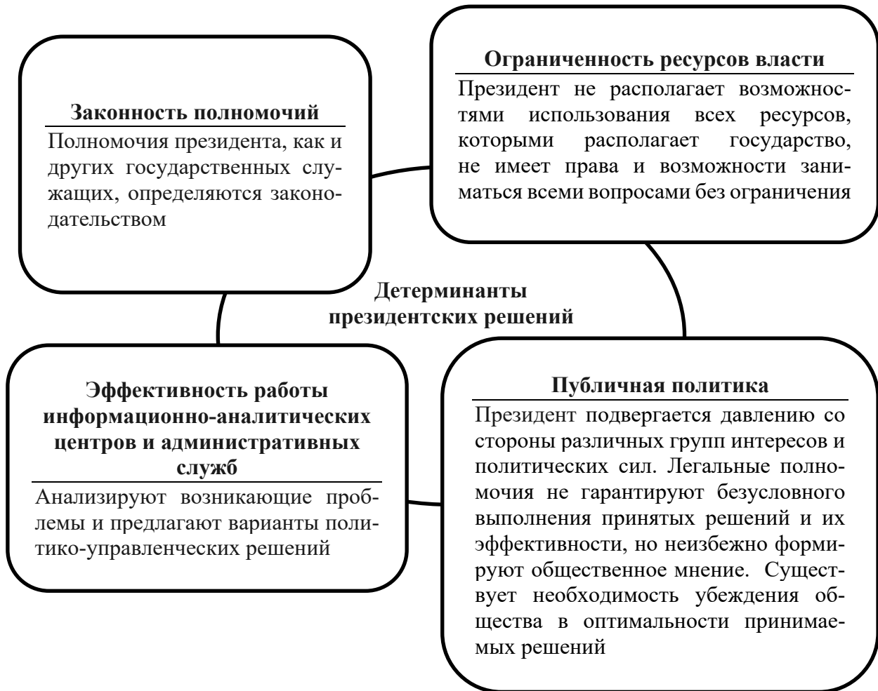
Рисунок 2 – Детерминанты президентских решений

Предельная численность делегатов Всебелорусского народного собрания составляет 1200 человек. Срок полномочий Всебелорусского народного собрания составляет пять лет, созывается не реже одного раза в год. Делегат Всебелорусского народного собрания принимает участие в работе Всебелорусского народного собрания без отрыва от трудовой (служебной) деятельности. Делегаты избирают Президиум – коллегиальный орган, обеспечивающий оперативное решение вопросов, входящих в компетенцию Всебелорусского народного собрания.