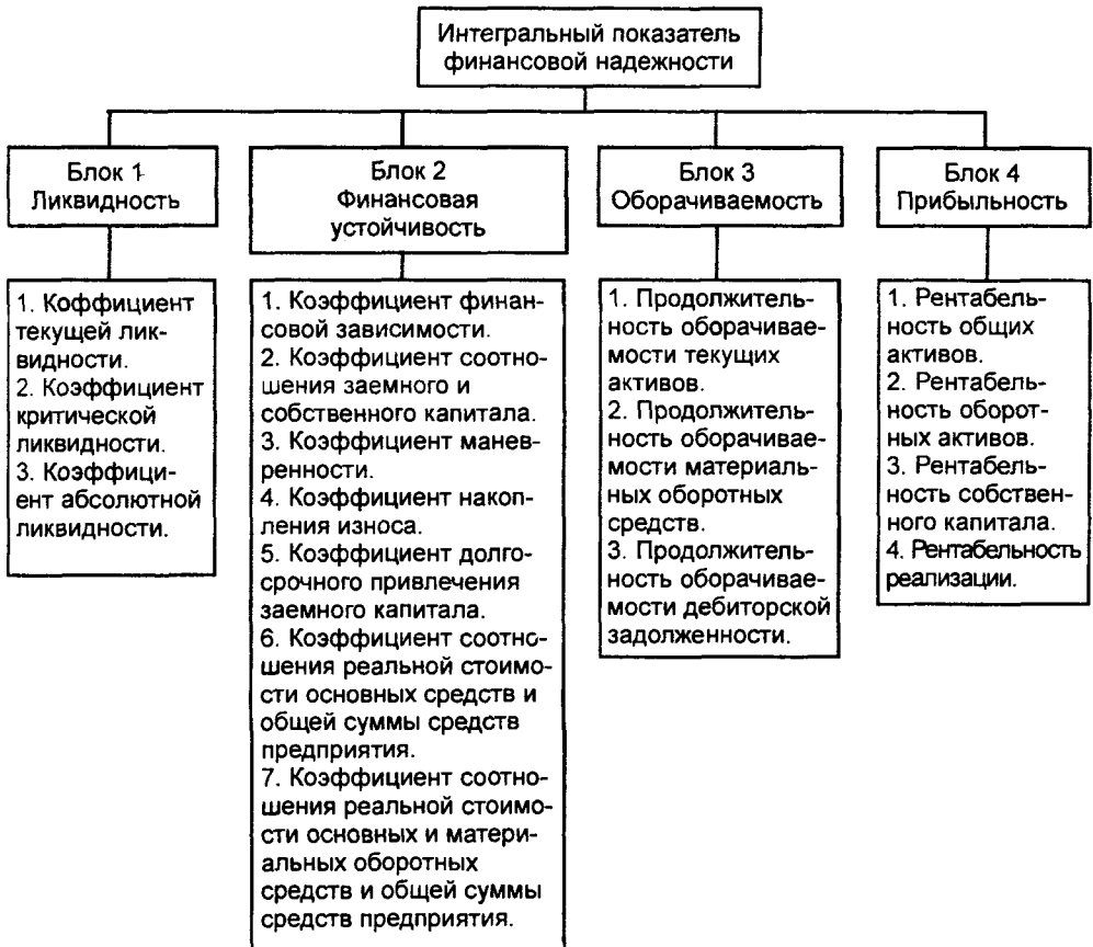
Схема 2. Структура интегрального показателя финансовой надежности

Маркетинговая (производственно-сбытовая) надежность (НМ) характеризует способность: