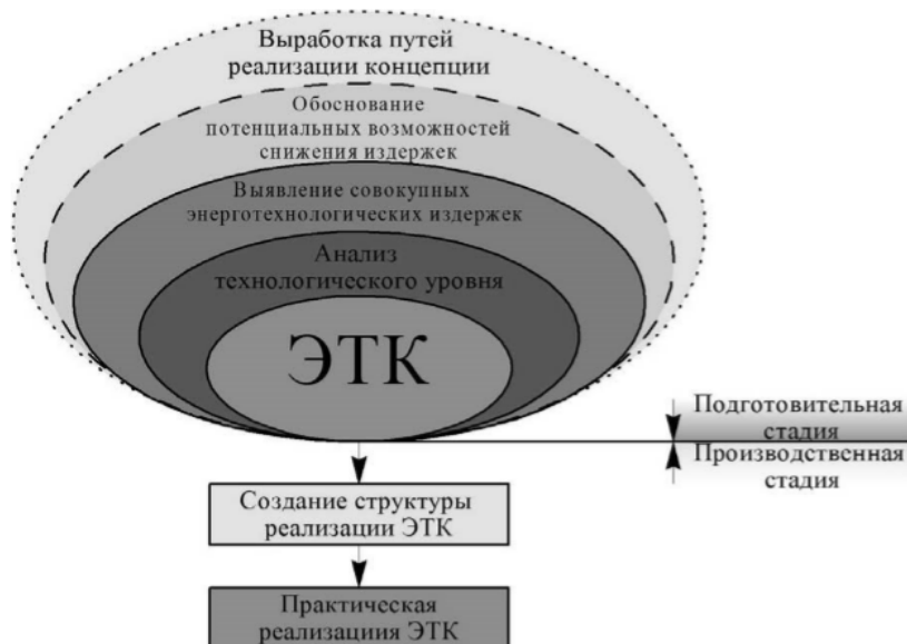
Рис. 1. Структура энерготехнологической концепции.

Рассмотрим последовательность этапов реализации энерготехнологической концепции (ЭТК) (рис. 1).