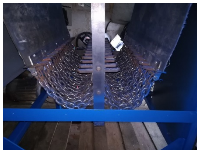
Рис. 3. Рабочее оборудование цепного агрегата, вид сбоку