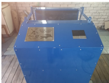
Рис. 2. Общий вид опытного образца цепного агрегата

Общий вид опытного образца цепного агрегата представлен на рисунке 2, его рабочее оборудование – на рисунке 3, а техническая характеристика дана в таблице 1.