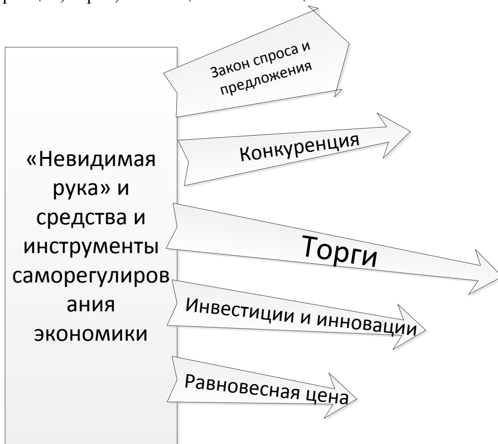
Рисунок 1 - «Строение» «невидимой руки».

На рисунке 1 показано «строение» «невидимой руки». Её компоненты: закон спроса и предложения, равновесная цена как проявление этого закона; конкуренция, торги, инновации и инвестиции.