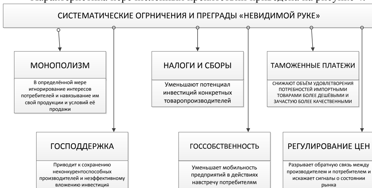
Рисунок 4 – Препятствия «невидимой руке».

Характеристика перечисленных препятствий приведена на рисунке 4.