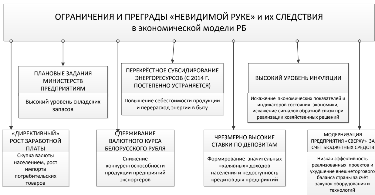
Рисунок 5 - «Невидимая рука» в экономике РБ

Директивные решения правительства недостаточно учитывают реальный спрос на продукцию белорусских предприятий, приводят к неэффективному использованию инвестиций. Высокая инфляция, необоснованный рост доходов населения (результат завышенных зарплат и сверхвысоких ставок по депозитам) и сдерживание валютного курса белорусского рубля провоцируют необоснованный спрос на импортные товары и искажают сигналы рынка. Правда, в последнее время в хозяйственной политике РБ произошли положительные изменения, несколько снижающие преграды «невидимой руке»: рост заработной платы обусловлен повышением производительности труда и сокращением персонала, курс национальной валюты стал более гибким, менее жёсткими стали задания предприятиям по выпуску продукции.