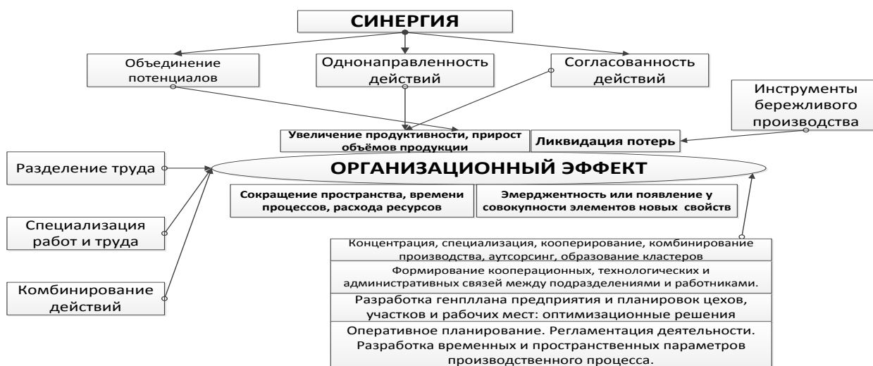
Рисунок 4 – Источники организационного эффекта в производстве

труда, инструменты бережливого производства, формы организации производства: концентрация, специализация, кооперирование, комбинирование ; оптимизация генплана предприятия и планировок оборудования в цехах и т.п. При этом, организационный эффект и его слагаемые на рисунке выделены жирным шрифтом.