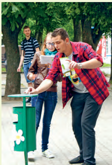
Участники акции «Дыши свободно»

Социально-педагогическая и психологическая служба.