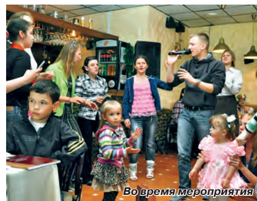
Во время мероприятия

В этом году праздник прошел в кафе-ресторане «Габрово», персоналом которого был организован для участников сладкий стол. 80 детей и их родители с удовольствием участвовали в развлекательной программе, в которой были и викторины на знание русских народных сказок, и загадки, и различные конкурсы, и, конечно же, музыкальные поздравления. Завершила праздничную программу дискотека для взрослых и детей. А «Веселый паровозик» с ветерком прокатил по городу ребят, которые раскрасили пасмурный июньский день своими солнечными улыбками.