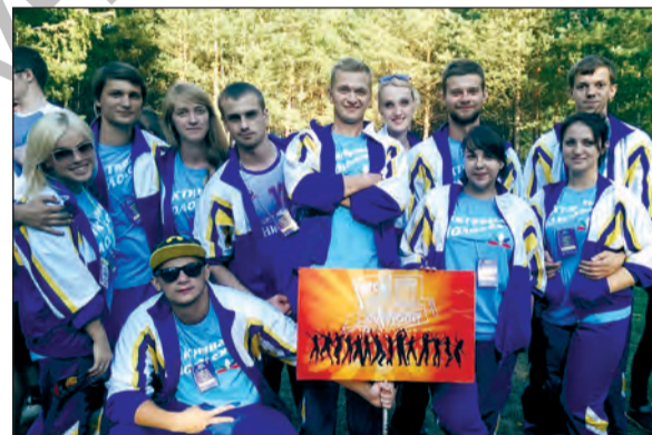
Команда университета навал, «Фильм! Фильм! Фильм!», на полосу препятствий «Миссия невыполнима» и других.

Ребята демонстрировали свои таланты в конкурсах «Боди-арт» – «Кар-