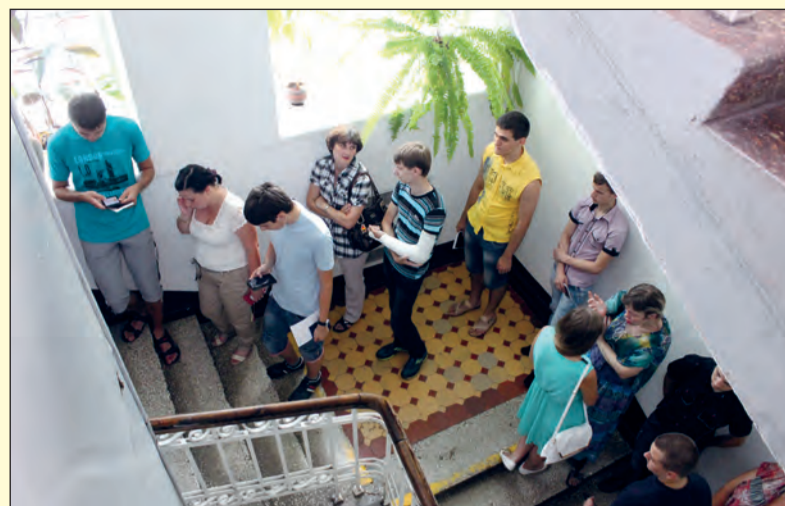
Очередь на заключение договоров

– На данный момент у меня нет стремления распланировать свое будущее. Для меня важно ценить и наслаждаться каждым днем, который мне дарует Бог, и я всецело верю Ему свое будущее. Естественно, я не совершенна, но в моем сердце столько тепла и радости, что мне непременно хочется этим делиться. Дарить улыбку, надежду и тепло, в которых мы все так нуждаемся! И я знаю, что такая жизнь не будет напрасной, она оставит след в сердцах людей, с которыми я соприкасаюсь. – Чем помимо науки вы увлекаетесь?