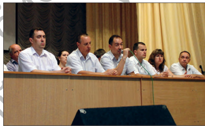
Открытое заседание приемной комиссии

вступительных испытаний и конкурса на заочную бюджетную форму обучения зачислено 79 человек (из них 46 на сокращенный срок обучения). На заочную платную форму обучения зачислено 415 человек (из них 329 на сокращенный срок обучения).