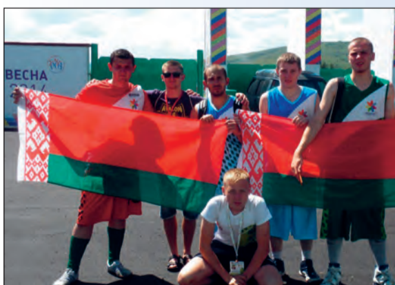
Сборная команда «Метеорит»

Российский союз молодежи и правительство Забайкальского края в пятый раз провели фестиваль «Студенческая весна стран Шанхайской организации сотрудничества». В этом году волна студенчества заполнила улицы города Читы. Почти четыре тысячи студентов из 14 стран приняли участие в этом грандиозном празднике молодежи.