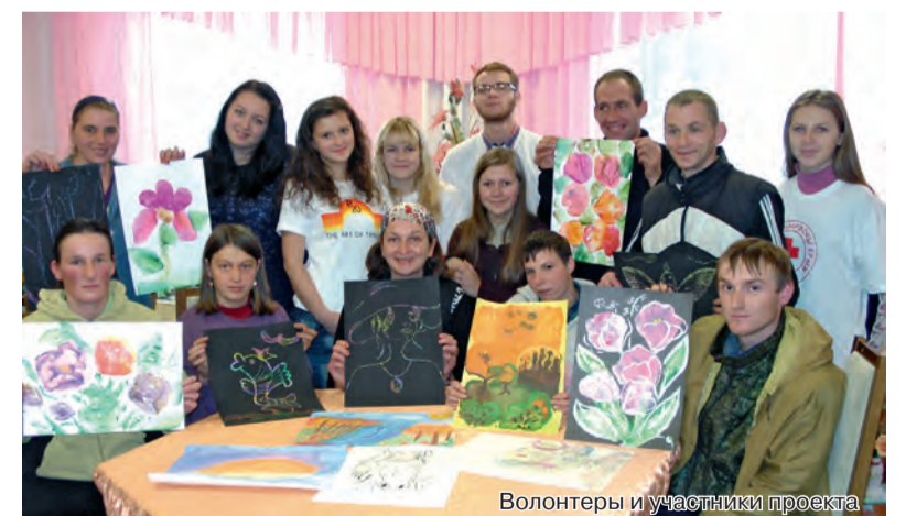
Волонтеры и участники проекта

Волонтеры провели серию арт-терапевтических занятий с душевнобольными людьми. Они с интересом и желанием работали в технике «монотипия», оставляя отпечатки на бумаге и цветном картоне гуашевыми и