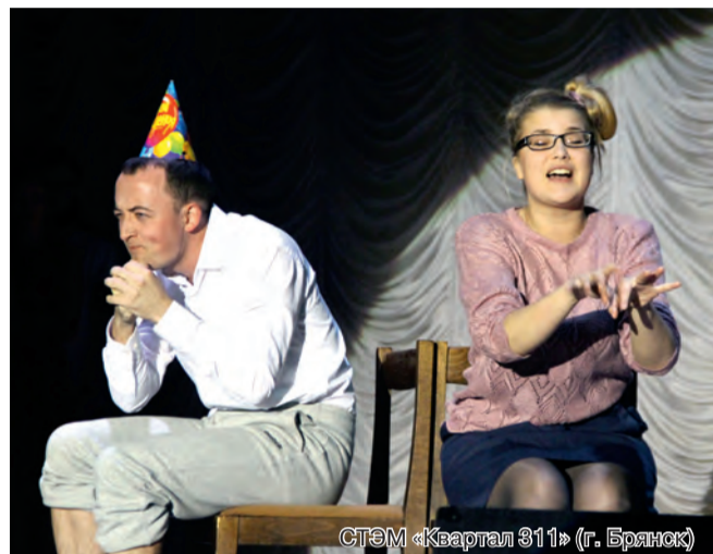
СТЭМ «Квартал 311» (г. Брянск)

конкурсе представили Белгородский государственный технологический университет им. Шухова, Тульский государственный университет, Брянская государственная инженерно-технологическая академия. Приднестровская Молдавская Республика была представлена Приднестровским государственным университетом им. Т.Г. Шевченко. Республику Беларусь в фестивале представили учебные заведения г. Могилева, а также Брестский государственный технический университет, Полоцкий государственный университет, Белорусская государственная сельскохозяйственная академия.