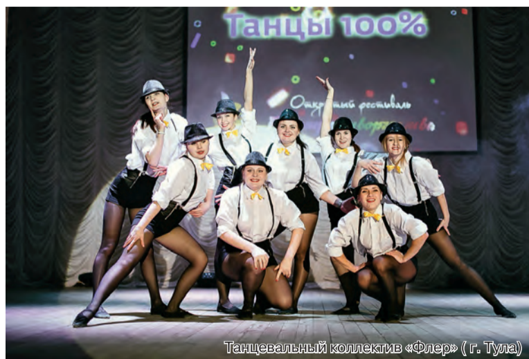
Танцевальный коллектив «Флёр» (г. Тула)