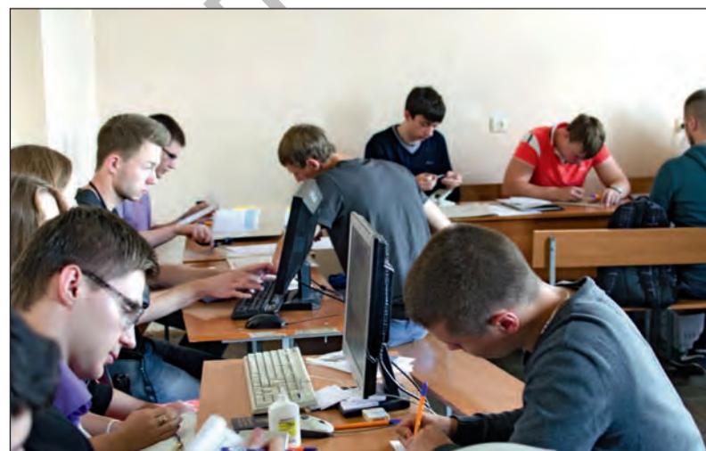
Работа сервисного отдела

Информация о конкурсе и проходных баллах сообщалась абитуриентам и их родителям на открытых заседаниях приемной комиссии, которые состоялись 22, 27 и 29 июля, 3 и 5 августа.