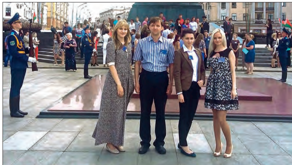
Делегация Белорусско-Российского университета

– Чтобы чего-то добиться, мало обладать одним лишь талантом. Я думаю, у человека, прежде всего, должно быть внутреннее желание достигать новых высот и стремление быть первым.