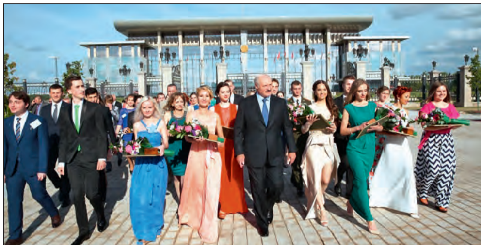
Александр Григорьевич Лукашенко с участниками бала

Врачи, юристы, учителя, инженеры, музыканты, журналисты и другие молодые специалисты приехали со всей республики 26 июня во Дворец Независимости. Президентский бал в этот день объединил 253 выпускника высших учебных заведений страны.