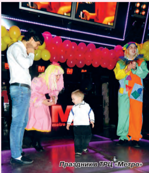
Праздник в ТРЦ «Метро»