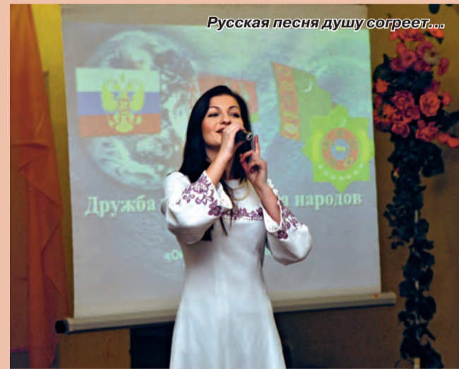
Русская песня душу согреет...