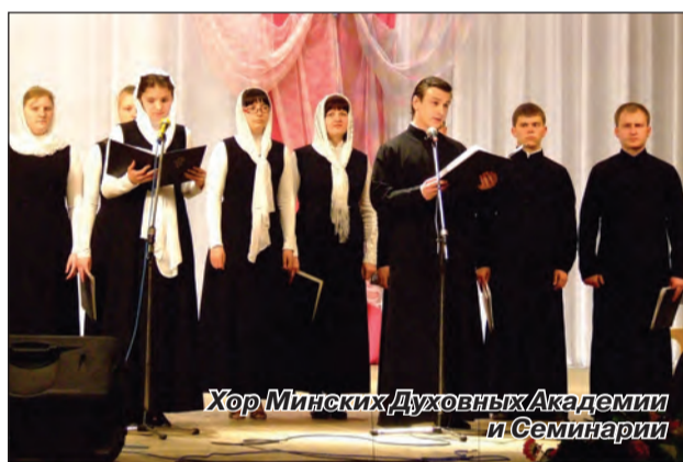
Хор Минских Духовных Академии и Семинарии

10–15 мая 2011 г. для студентов вузов Могилевской области в Белорусской государственной сельскохозяйственной академии в г. Горки проходила молодёжная школа «Духовная культура и молодёжь». Среди участников были и студенты автомеханического, машиностроительного и электротехнического факультетов Белорусско-Российского университета. Программу конференции была интересной, разнообразной и очень насыщенной. Торжественное открытие, лекции и беседы, экскурсии, выступления художественной самодеятельности и хора Минских Духовных Академии и Семинарии, спортивные состязания – все переплелось и дополнило друг друга. Представляем вашему вниманию наши самые яркие впечатления.