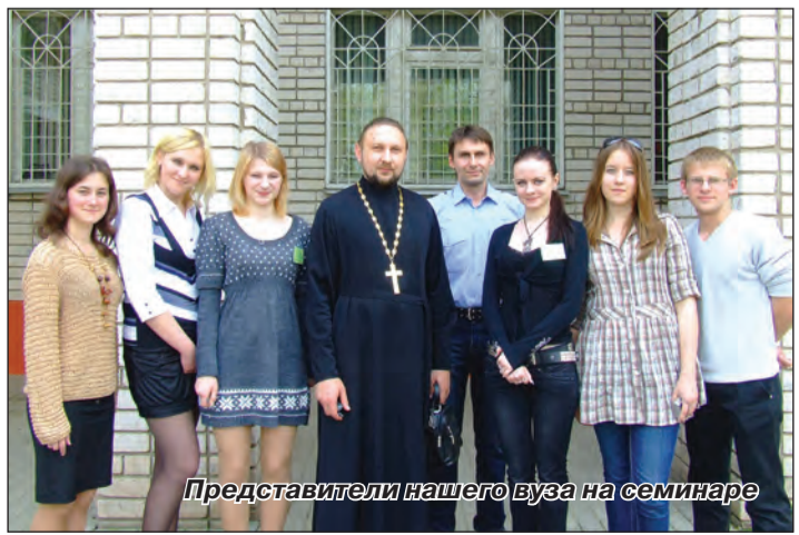
Представители нашего вуза на семинаре