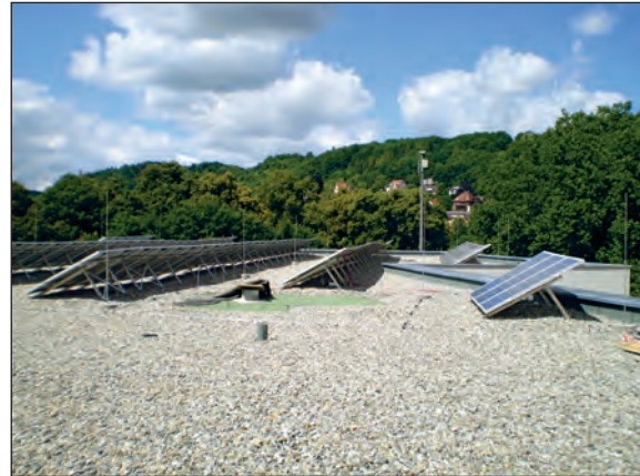
Солнечные батареи – неотъемлемая часть пейзажа