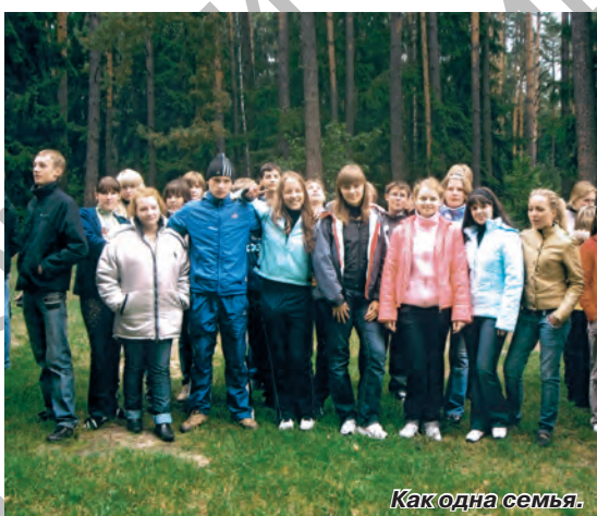
Как одна семья.

компанемент возгласов одобрения, шуток, смеха, аплодисментов болельщиков и болельщиц. Разумеется, обед после такой напряженной борьбы был просто чудесным (ох, что за прелесть – сосиски, запеченные на лесном костре!). После обеда непоседы умчались дальше выяснять,