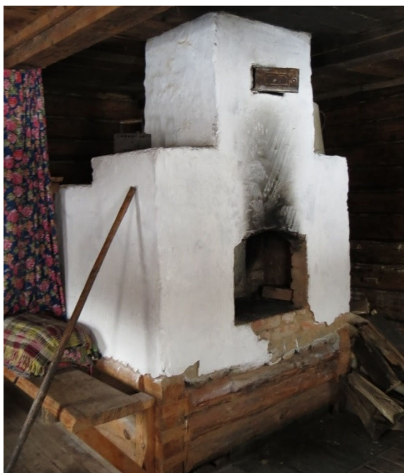
Рис. 2. Традиционная каменная печь на деревянном срубном основании

сразу четко ориентирует посетителя на то, что данный объект не является бутафорией, а активно используется в жизнедеятельности. Установленные на входных дверях старые петли и засовы (частично снятые со старых строений), издающие при открывании шумные легкоузнаваемые звуки, также обеспечивают определенную отсылку к деревенскому быту. Грубая обработка старой мебели, поверхности древесины, отшлифованные многолетним использованием, а также фактура, полученная в результате незначительного поражения насекомыми, позволяют получить специфические тактильные ощущения при непосредственном контакте. Таким образом формирование архитектурного образа осуществляется не только за счет визуального восприятия объектов, но и посредством других органов чувств. Это позволяет создать для посетителя более глубокое ощущение и понимание сути традиций сельского образа жизни, труда и быта.