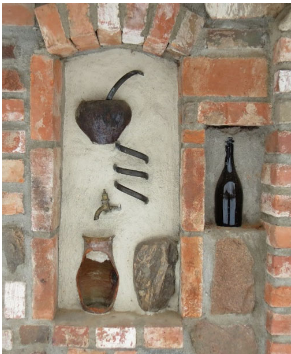
Рис. 4. Имитация самогонного аппарата при декоративном оформлении кирпичных стен свирна

Некоторые архитектурно-декоративные элементы, используемые на территории комплекса, выполнены с определенной долей юмора и являются объектами привлечения внимания посетителей. Используются, например, ненужные детали швейной машинки и имитация самогонного аппарата (рис. 4, 5), расположенные по разным сторонам от входа свиран.