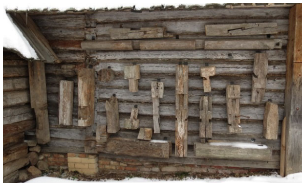
Рис. 1. Экспозиция традиционных соединений деревянных строительных конструкций

тивных решений народного зодчества, по которым можно сделать вывод о высоком мастерстве белорусских плотников (рис. 1).