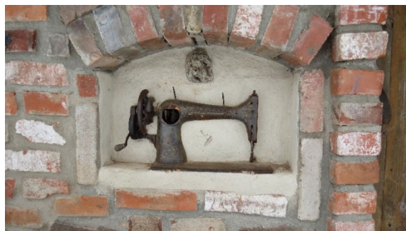
Рис. 5. Декоративное оформление кирпичных стен свирна при помощи деталей швейной машинки

Эти детали формируют положительный отклик и при этом выполняют роль фотозон, что в настоящее время стало востребованным.