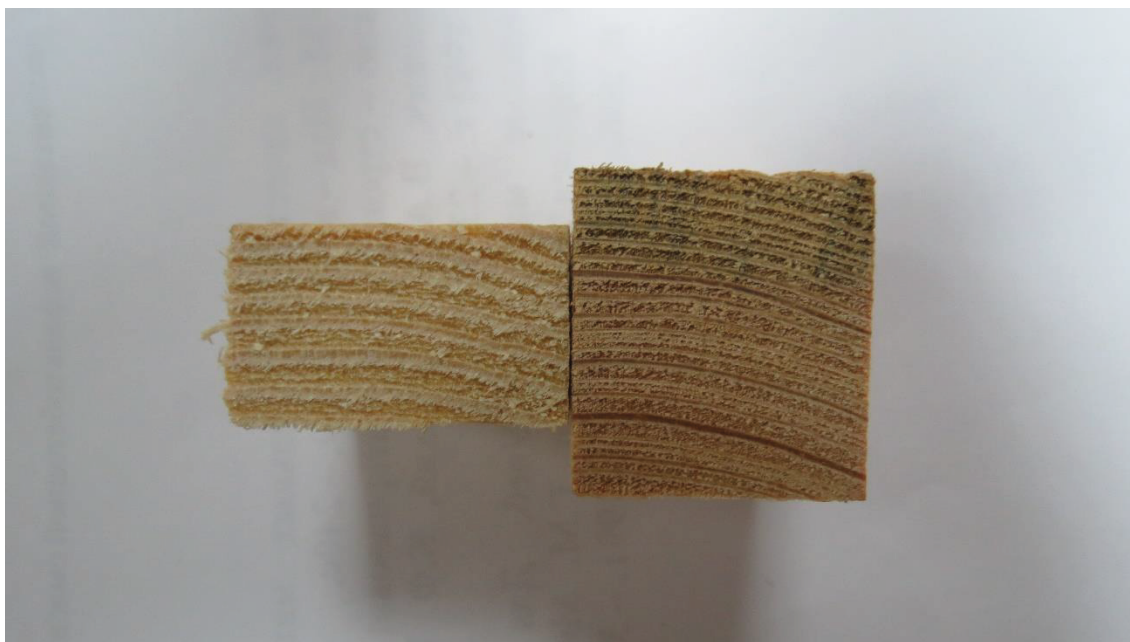
Рис. 2 - Поперечное сечение образцов

Кроме того, влияние климатического фактора можно проследить и непосредственно по изменению структуры древесины. На поперечном спиле более поздних образцов годовичные кольца значительно толще по сравнению со старой древесиной. Так толщина слоев более молодой древесины составляет в среднем 2,8 мм, в то время как для образца, выпиленного из стропильной системы, данный показатель равен 1,2 мм (рис. 2). При этом образцы, изготовленные из брусков, имеют ярко выраженную более рыхлую структуру.