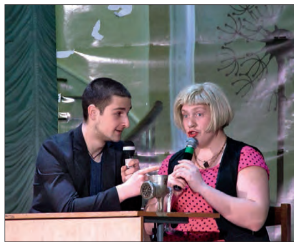
Выступление студентов строительного факультета

Татьяна ЛУЖКОВА.