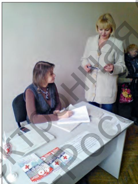
Запись на медицинское обследование

С 2006 года волонтерский клуб «От сердца к сердцу» выступает под эгидой Белорусского Общества Красного Креста. Традиционными стали совместные акции по здоровому образу жизни, приуроченные к тематическим датам. За время совместного сотрудничества волонтерский клуб выиграл и реализовал гранты по следующим проектам: «Сохрани себя для жизни» (по профилактике ВИЧ/СПИД среди молодежи); «Доктор-Клоун» (по преодолению изолированности семей, воспитывающих детей-инвалидов и молодых инвалидов); «Предотвратим торговлю людьми вместе» (по проблеме траффинга); «Пишем жизнь яркими красками» и «Краски души» (по реабилитации и адаптации душевнобольных людей посредством внедрения методов арт-терапии); «Не попадись в паутину рабства» (по проблеме торговли людьми). На Международном молодежном форуме в г. Пскове (Российская Федерация) в 2015 году проект «Краски души» был награжден дипломом 1-й степени в номинации «Социальный проект».