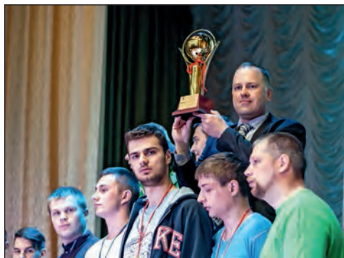
Победный кубок у машиностроительного факультета

19 мая состоялось торжественное закрытие круглогодичной спартакиады Белорусско-Российского университета среди факультетов и общежитий. Спортивные