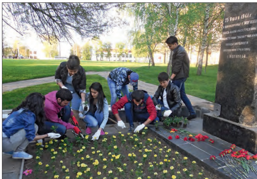
Туркменские студенты высаживают цветы на братской могиле