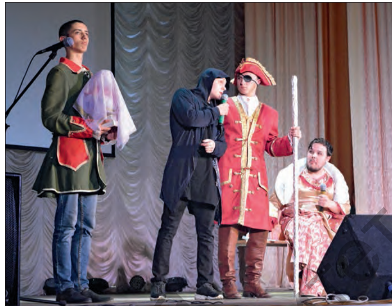
Выступление студентов машиностроительного факультета

– конкурс команд КВН (1-е место заняла команда строительного факультета, 2-е – машиностроительного, 3-е – инженерно-экономического факультета);