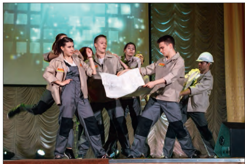
Танцевальный коллектив «EXCITE»