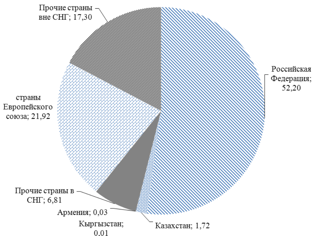
Рисунок 2 – Доля импорта внешней торговли товарами в Могилевской области за 2019 год

Из таблицы 2 видна положительная динамика импорта внешней торговли товарами за 2019-2018 гг. как общего показателя, так и практически по всем отдельным странам. Со странами СНГ в 2019-2018 гг. прирост импорта товаров составил 4,9%, в 2018-2017 гг. – 10,2%. Со странами вне СНГ прирост импорта в 2019-2018 гг. составил 15,9%, в 2018-2017 гг. – 18,8%.