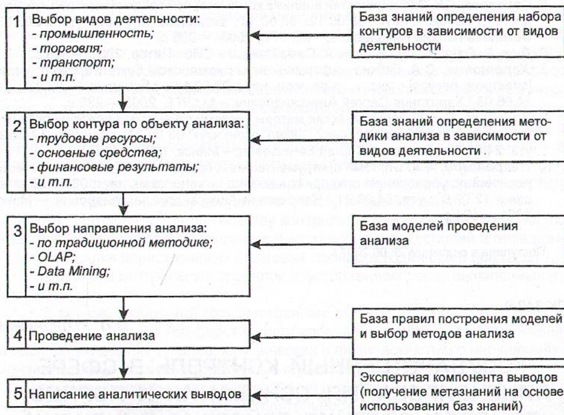
Рис. 3. Блок-схема выбора набора контуров экономического анализа по видам деятельности предприятия

Таким образом, использование инструментального средства, реализованного в гибком аналитическом комплексе позволит проводить комплексный анализ различной степени сложности: получить общую оценку сложившейся на предприятии ситуации и поверхностно выявить причины ее динамики на базе традиционных методов анализа, использование OLAP-технологий позволит многомер-