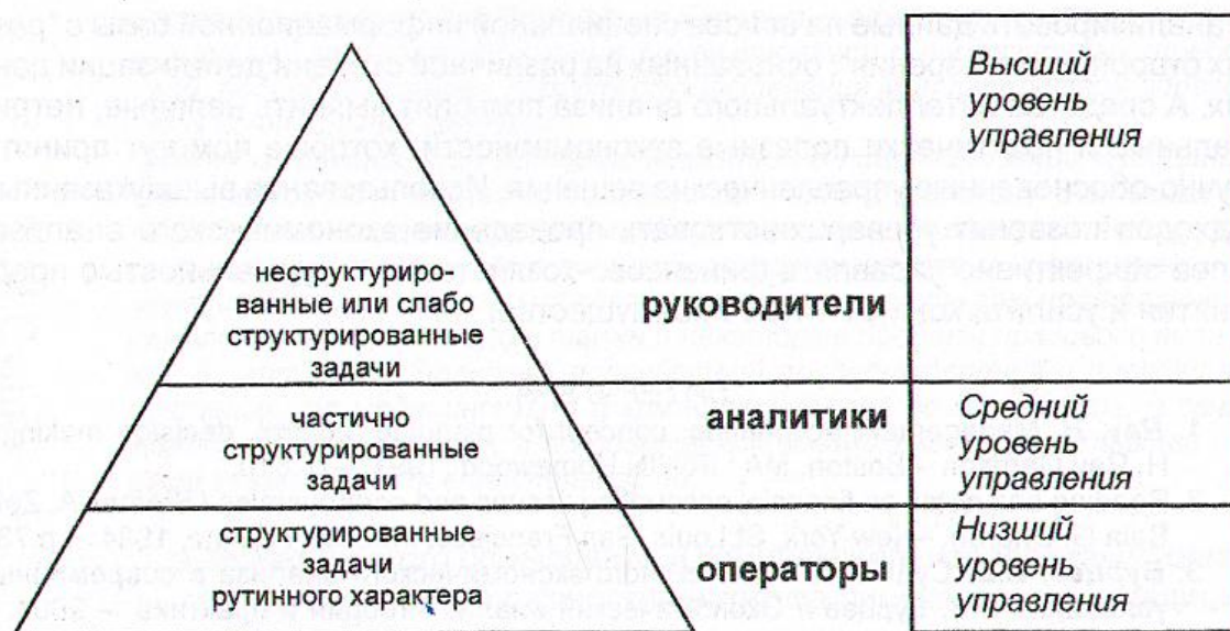
Рис. 2. Иерархия принятия управленческих решений от типа структурированности задач