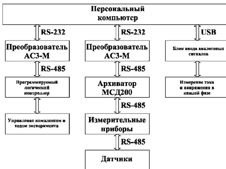
Рисунок 2 – Система автоматизированного эксперимента

Для измерения и регистрации экспериментальных данных была разработана так называемая система автоматизированного эксперимента, функциональная схема которой представлена на рисунке 2.