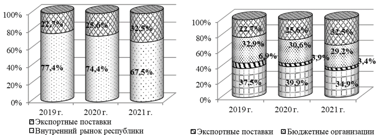
Рис. 2. Структурная динамика реализации продукции ОАО «Быховского консервно-овощесушильного завода» по каналам распределения

говым рынке проводились маркетинговые усилия по вхождению и расширению емкости в сети гипермаркетов. Графическая интерпретация аналитической информации представлена на рис. 2.