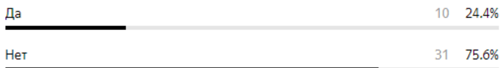
Рисунок 5 – Результаты опроса о готовности дать свое имущество в пользование другим людям

Что касается совместного использования имущества, опрос показал, что более 75 процентов студентов не готовы отдать свое имущество на временное изъятие (рисунок 5), а 48 процентов заявили, что они были бы готовы временно использовать чужое имущество (рисунок 6).