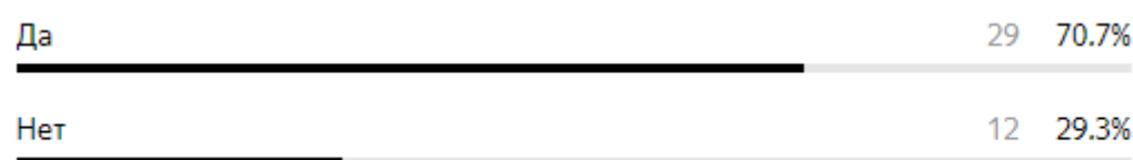
Рисунок 2 – Результаты опроса по онлайн-сервису Booking (критерий «полезность»)

Исследование показало, что высокий процент студентов (97 %) знают об услугах райдшеринга, таких как Uber и Яндекс-такси. Высокий процент студентов, 82.9 %, пользовались услугами данных сервисов (рисунок 3). Это говорит о том, что райдшеринг – популярная услуга среди студентов и что им удобно пользоваться этими платформами.