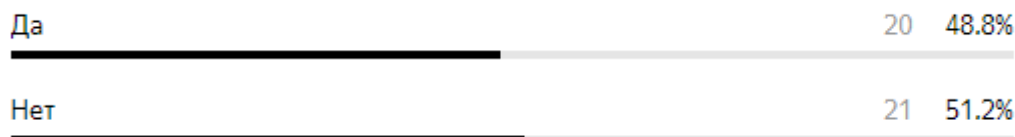
Рисунок 6 – Результаты опроса о готовности использовать чужое имущество

В целом результаты опроса показывают, что студенты осведомлены и положительно относятся к экономике совместного использования. Наиболее важным критерием при выборе онлайн-платформ является стандарт качества (90,6 %). Экономия затрат также оказалась весомым фактором при выборе услуг экономики совместного потребления.