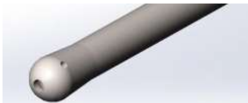
Рис. 2. Рабочий наконечник концентратора-волновода

Для обеспечения максимального эффекта разрушения внутрисосудистых образований путем виброударного воздействия при ультразвуковых колебаниях на дистальном конце концентратора-волновода сформирован сферический наконечник, в котором имеются осевое и боковые отверстия предназначенные для воздействия кавитационной струей, как на внутрисосудистое образование, так и на пораженный участок сосудистой стенки (рис. 2).