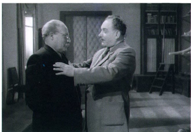
Ілюстрацыя 3. Чарнавуc і Гарлахваці.