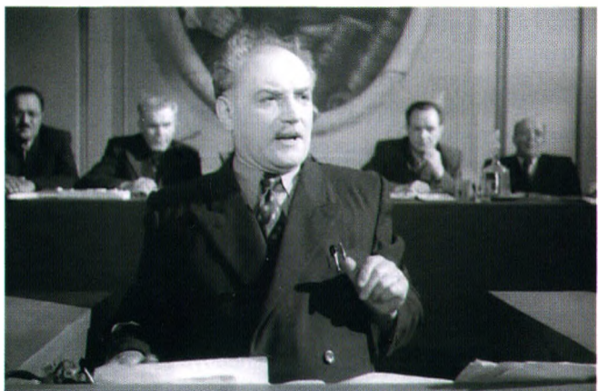
Ілюстрацыя 5. Гарлахваці за трыбунай.

“Цёця Каця выходзіць з дзвярэй дырэктаравага кабінета. За ёю Нічыпар. Цёця Каця. Фу!.. Добра, што ты якраз падышоў, я ж бы адна гэтаму сталу і рады не дала. Нічыпар. Гэта, брат, стол! Каб некалі мне такі пляц зямлі, то я б гаспадаром быў. Цёця Каця. Новы поп, дык новае і маленне. У таго дырэктара, бывала, адзін столік, два крэслы і усё. А ў гэтага ж стол гэтакі, а на стале ж мартаплясаў усялякіх панастаўляна — таксама грошай каштуюць. Нічыпар. А што яму — шкада казённых грошай? Не з сваяе ж кішэні плаціць” [6, с. 7].