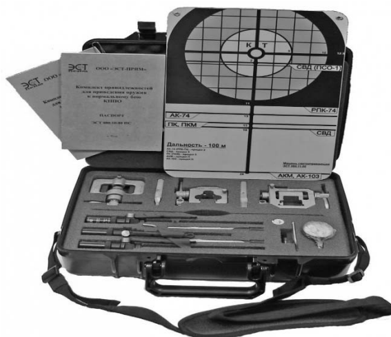
Рис. 1. Комплект ПКСО – проверочный комплект для стрелкового оружия

Подготовка штатного вооружения и прицелов включает в себя осмотр оружия и прицелов, выполнение мероприятий по подготовке их к стрельбе, копчение мушки,