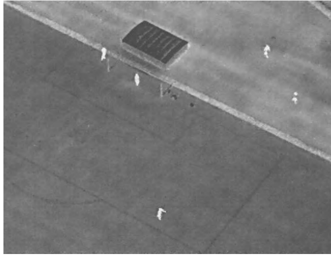
Рис. 1. Тепловизионное изображение с БПЛА