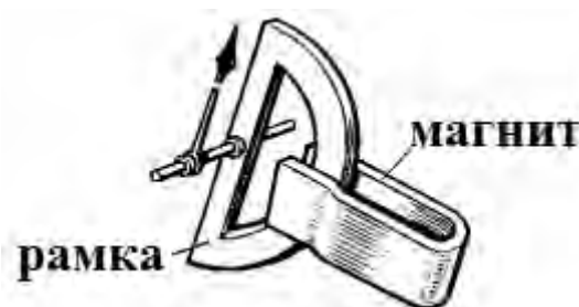
Рисунок 3.1 – Магнитно-индукционный демпфер

Магнитно-индукционный демпфер (рисунок 3.1) представляет собой пластину из алюминия, которая закреплена на поворотной оси прибора, и всегда движется вместе со стрелкой в поле постоянного магнита. Возникающие вихревые токи тормозят катушку. Суть в том, что по правилу Ленца вихревые токи в пластине, взаимодействуя с порождающим их магнитным полем постоянного магнита, препятствуют движению пластины и колебания стрелки быстро затухают. Роль такого магнитно-индукционного демпфера и выполняет алюминиевый каркас, на который намотана катушка.