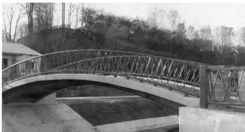
Рис. 2. Пешеходный мост через реку Дубровенка в г. Могилеве (2005 г.)

Впервые, по инициативе Могилевского облисполкома, на базе КНЭСК в 2005 г. спроектирован и возведен пешеходный мост через реку Дубровенка в городе Могилеве (рис. 2).