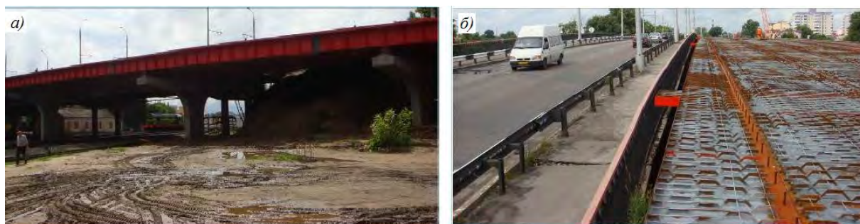
Рис. 4. Путепровод (первая очередь) по ул. Полесской в г. Гомеле (2011 г.): общий вид путепровода (а) и фрагмент мостового полотна на этапе монтажа (б)

Применение КНЭСК в несущих конструкциях мостового полотна автодорожных путепроводов над путями железнодорожных линий имеет следующие преимущества: