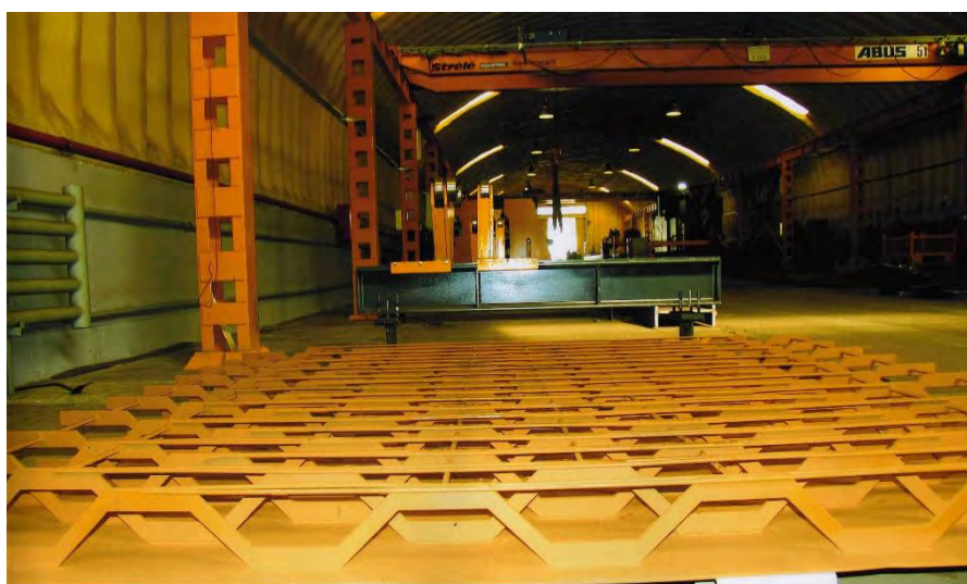
Рис. 5. Опытный образец КНЭСК (март 2012 г.) для второй очереди путепровода по ул. Полесской в Гомеле

Расширение применения КНЭСК приводит к совершенствованию известных и разработке новых конструктивных форм инженерных сооружений, позволяет генерировать новые технические решения для различных классов надземных, подземных и подводных сооружений, чем создаётся важная предпосылка дальнейшего научно-технического прогресса в различных отраслях техники.