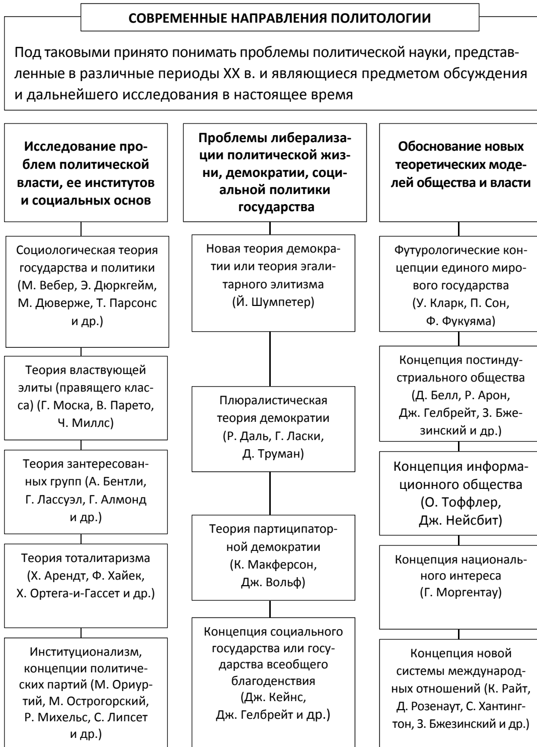
Рисунок 6 – Современные направления политологии