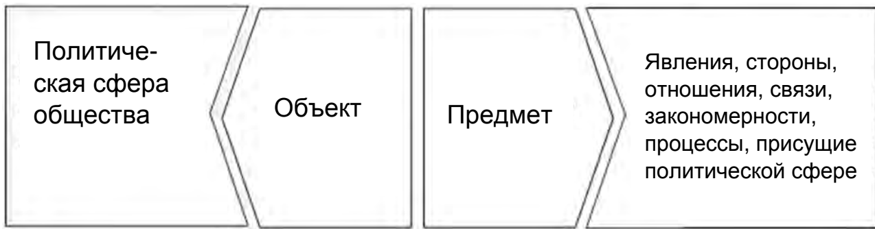
Рисунок 1 – Объект и предмет политологии

Предмет политической науки – это совокупность, наиболее существенных свойств и признаков ее объекта, т. е. политики, политических отношений, политической власти, политических систем, а также закономерные связи, процессы, отношения, возникающие в политике (рисунок 1).