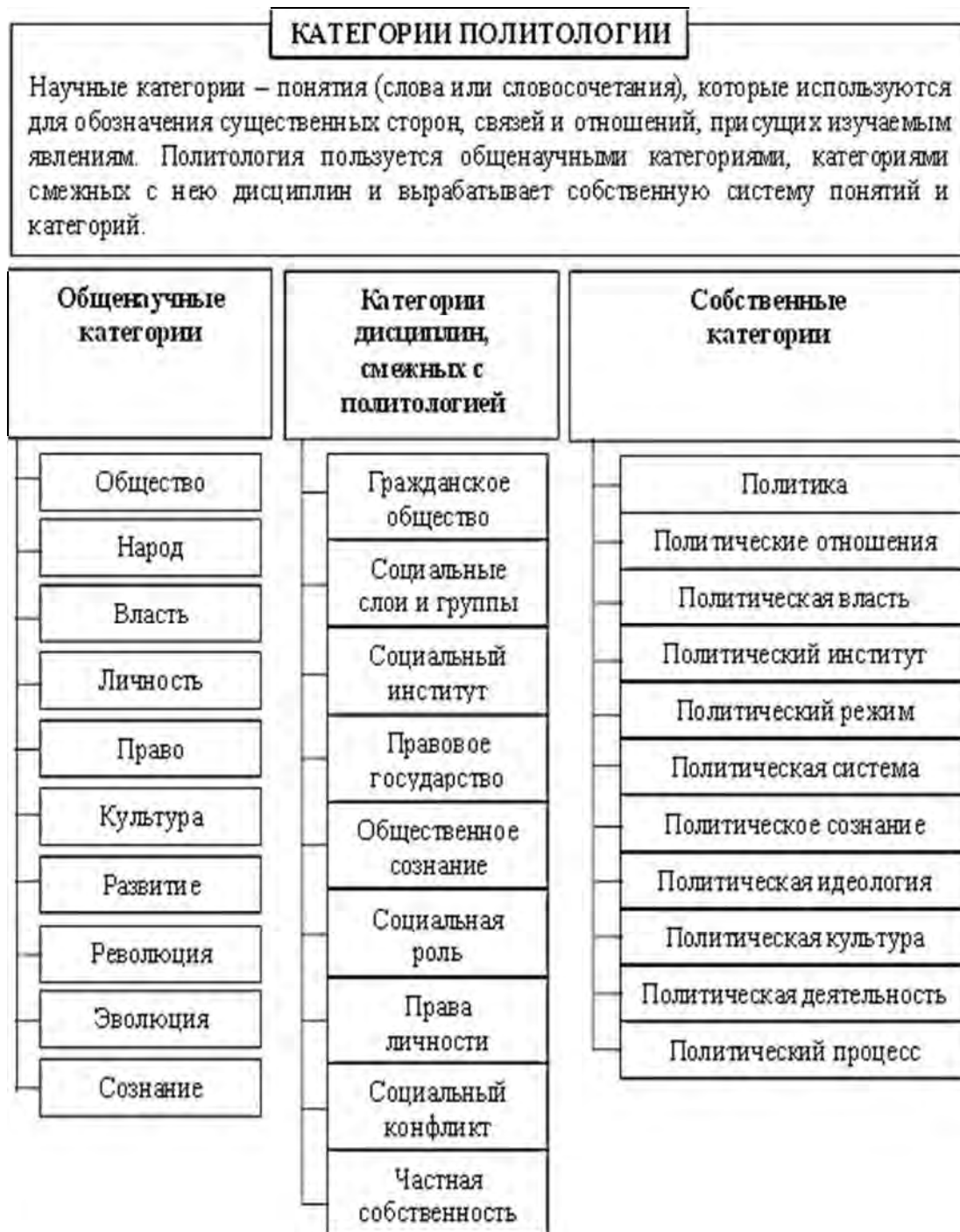
Рисунок 3 – Категории политологии

Категории политологии – это наиболее общие понятия, отражающие различные стороны предмета, раскрывающие механизм проявления, действия изучаемых законов и закономерностей (рисунок 3).