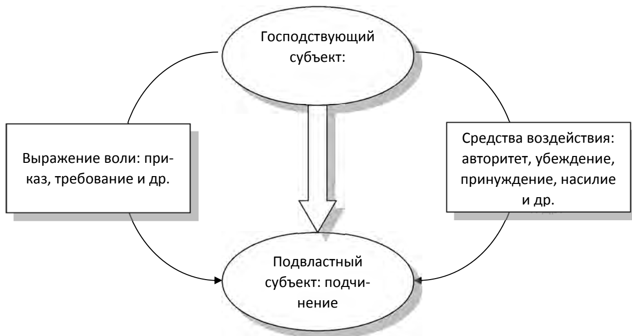
Рисунок 7 – Условия возникновения власти

Понятие «власть» зародилось в период античности в городах-государствах Древней Греции. Возникновение и функционирование института власти было связано с необходимостью регулирования асимметричности взаимоотношения граждан, реализации их интересов и воли в рамках определенных обществ. Со временем в сознании людей сформировалось представление о власти как способности, возможности и умении ее субъектов оказывать решающее воздействие на поведение и деятельность других людей (рисунок 7).