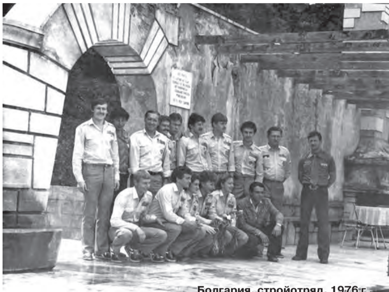
Болгария, стройотряд, 1976 г.

За инициативу в социалистическом соревновании ВЛКСМ был награжден в 1931 году орденом Трудового Красного Знамени.