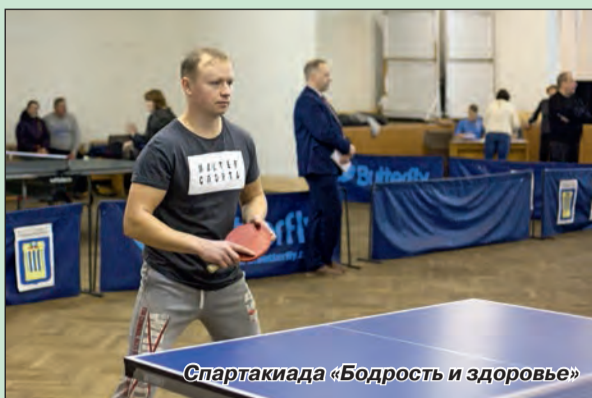
Спартакиада «Бодрость и здоровье»