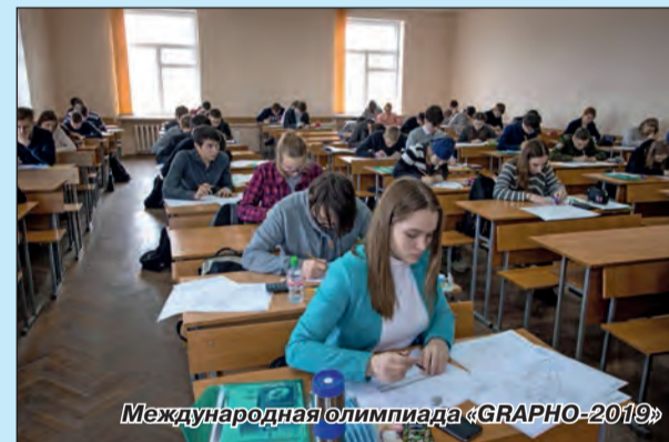
Международная олимпиада «GRAPHO-2019»

На республиканском конкурсе педагогических проектов «ЕСТЬ ИДЕЯ!» были представлены работы по шести направлениям: