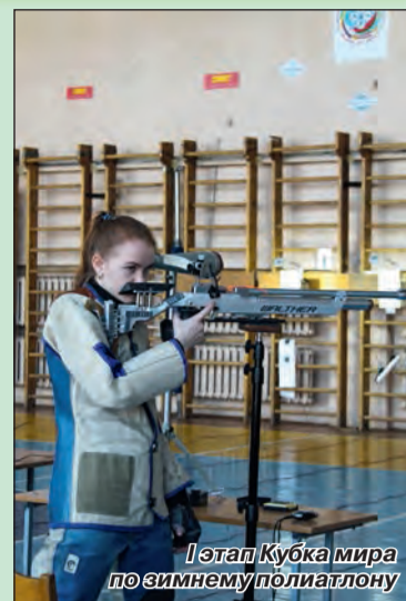
Этап Кубка мира по зимнему политолону