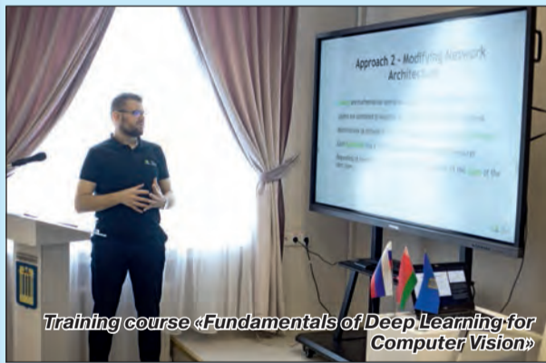
Training course «Fundamentals of Deep Learning for Computer Vision»

курс детского рисунка «Я рисую науку», на которую было заявлено более 400 работ, 123 из них вышли в финал. Победителями стали: